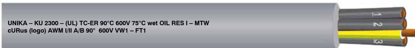
UNIKA – KU 2300 – (UL) TC-ER 90°C 600V 75°C wet OIL RES I – MTW cURus (logo) AWM I/II A/B 90° 600V VW1 – FT1

Single and multicore, unarmoured power and control cables rated 0,6/1 kV specifically suitable for installation aboard machine for USA market according to UL 1277